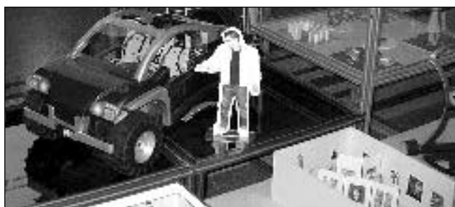
Свои витрини подредиха в Централното фойе студентите, обучавани от специалистите в катедра „Промислен дизайн“